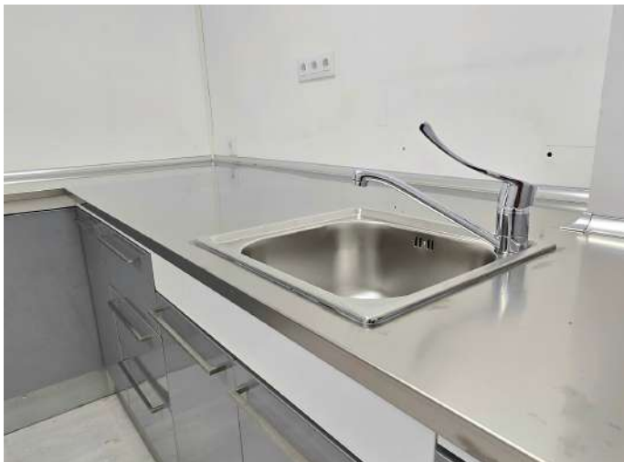
Detalle fregadero de inox y grifo gerontológico