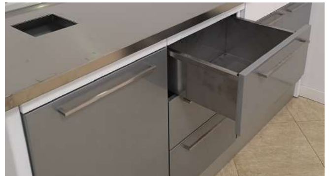
Detalle cajón de inox para escayola