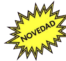
Mini - Box repasado