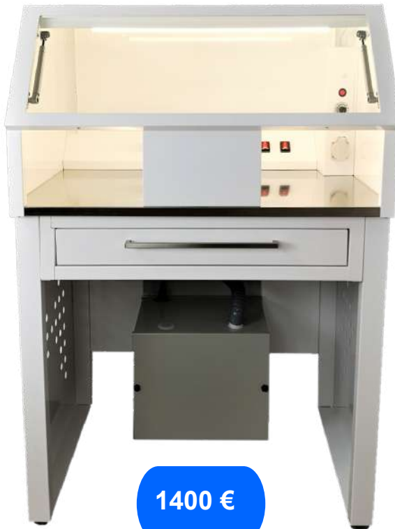
Pupitre de repasado Eco