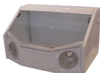
MINI BOX REPASADO CON LUZ