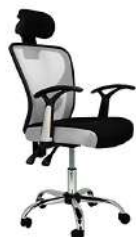
SILLA SILLA LABORATORIO ECO