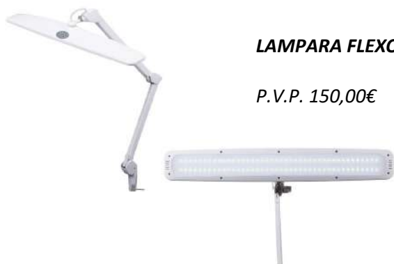
LAMPARA FLEXO LED ARTICULADO