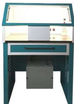
PUPITRE REPASO ECO